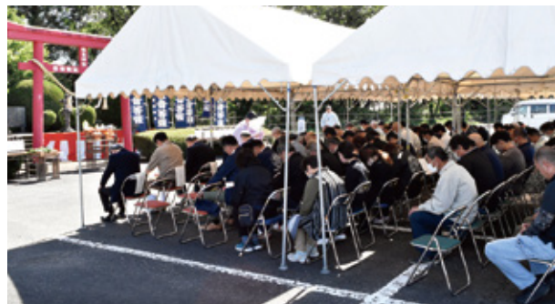
【小林市馬頭観世音祭】

4月3日、野尻町馬頭観世音祭が松山検査場で、4月18日、高原町馬頭観世音祭が出口畜産振興センターで行われました。