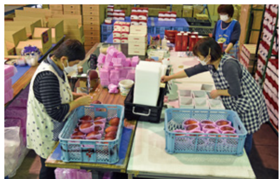
メロン・マンゴー出荷準備の様子③