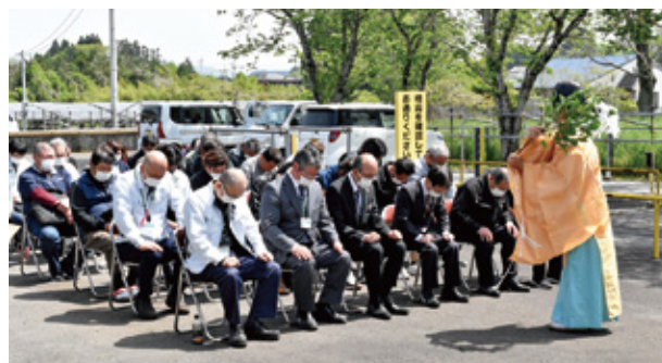
【高原町馬頭観世音祭】