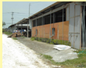
畜舎入口への石灰散布