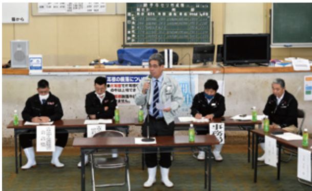
宮原市長のあいさつ