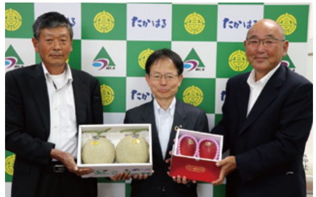
左から中岡委員長・高妻町長・松田副委員長