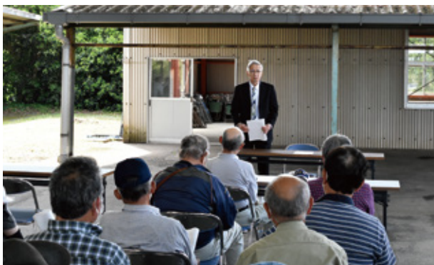
寺師組合長のあいさつ