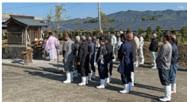
【野尻町馬頭観世音祭】

4月3日、野尻町馬頭観世音祭が松山検査場で、4月18日、高原町馬頭観世音祭が出口畜産振興センターで行われました。