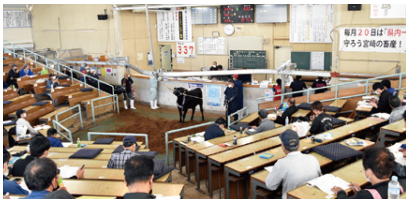
5月期子牛セリ市風景 (単位：頭、円)