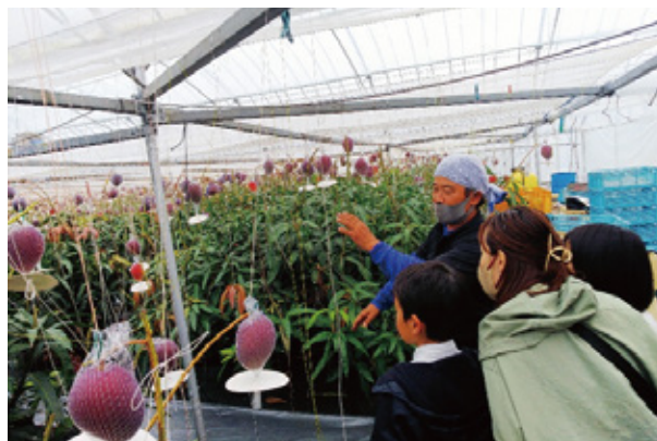
【マンゴー収穫方法の説明の様子】

参加した保護者は「大変貴重な体験をさせてもらった。今後もぜひ続けて欲しい。」と話されていました。