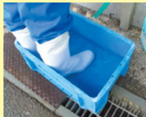
踏み込み消毒槽の設置

畜産農家の皆さんは、飼養衛生管理基準を守って頂くとともに、畜舎内の衛生管理を点検し、一斉に畜舎等の消毒を行いましょう。