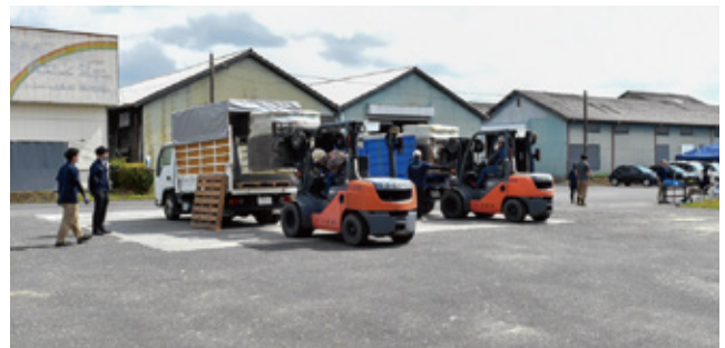
牧草を積載する様子