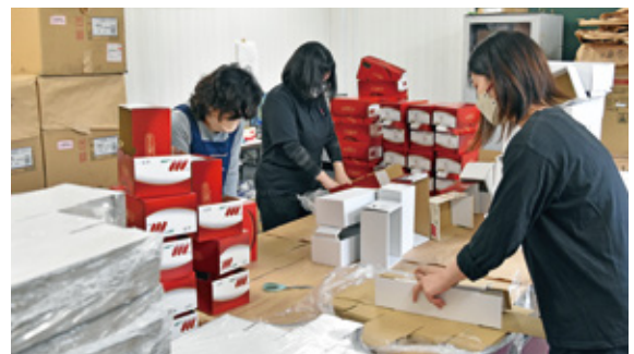
メロン・マンゴー出荷準備の様子①