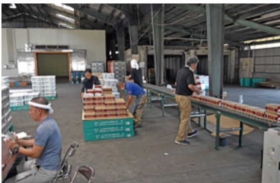
メロン・マンゴー出荷準備の様子②