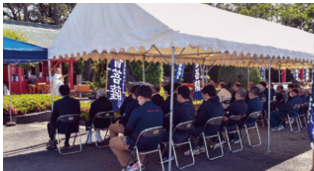
【西諸畜連馬頭観世音祭】

5月8日、西諸畜連と小林市の馬頭観世音祭が多数の畜産関係者を集め西諸畜連で行われました。同市場でJAや行政団体・取引先などから、畜産関係代表者等の参加がありました。昨年度は、同市場にて年間取引14,642頭（売却頭数）の子牛が取引されています。 同市場内の馬頭観世音菩薩堂と保食神社で行われた仏事と神事では、畜産関係者が家畜の生産安定と慰霊、畜産農家の繁栄と家畜の安全などを祈願しました。