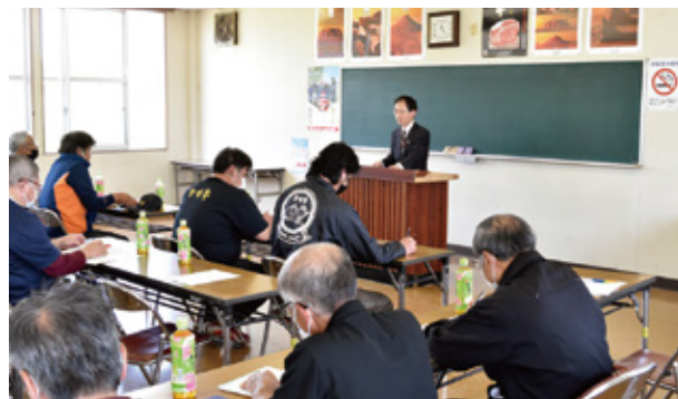
あいさつをされる高妻町長