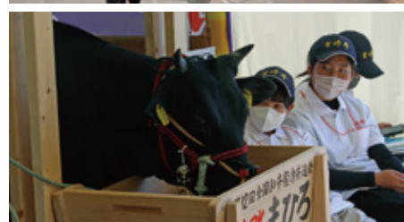
全国和牛能力共進会での「チーム宮崎」の様子