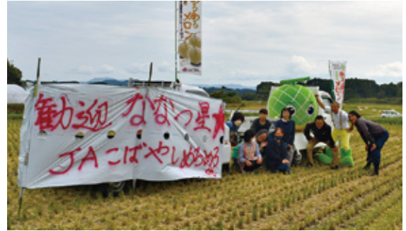
ななつ星列車に向けて手を振る、JAこばやしメロン部会、女性部の方々とマスコットキャラクターのめろめろくん