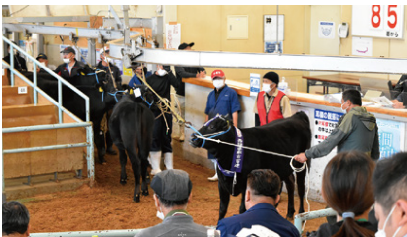
10月期子牛セリ市風景