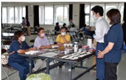
熱心に説明を受ける女性部のみなさん

9月28日、くらし企画課は共同購入商品見本市を開催しました。エコープの目玉商品を各コーナーごとに見本品を手に取りながら試食し商品の説明を受けました。