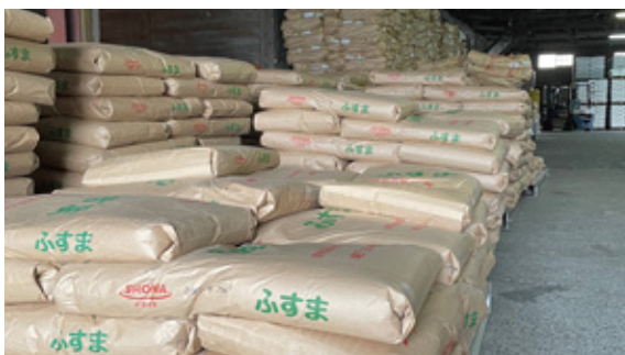
準備され積まれたふすま