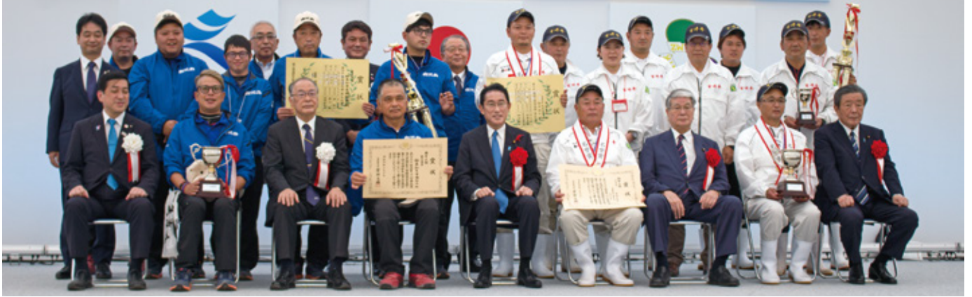
岸田内閣総理大臣と受賞者の皆さんとの記念撮影