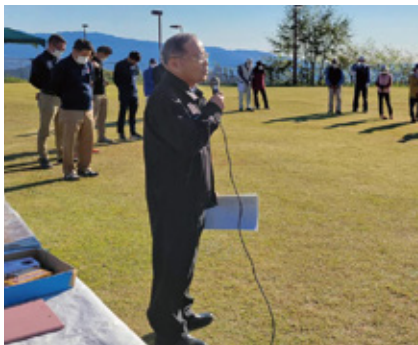
開会式での入佐組合長あいさつ