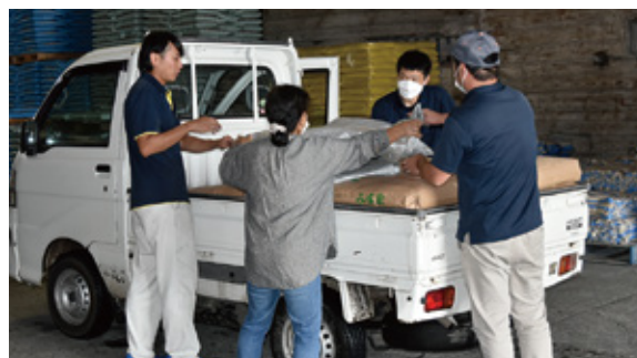
積み込み作業の様子