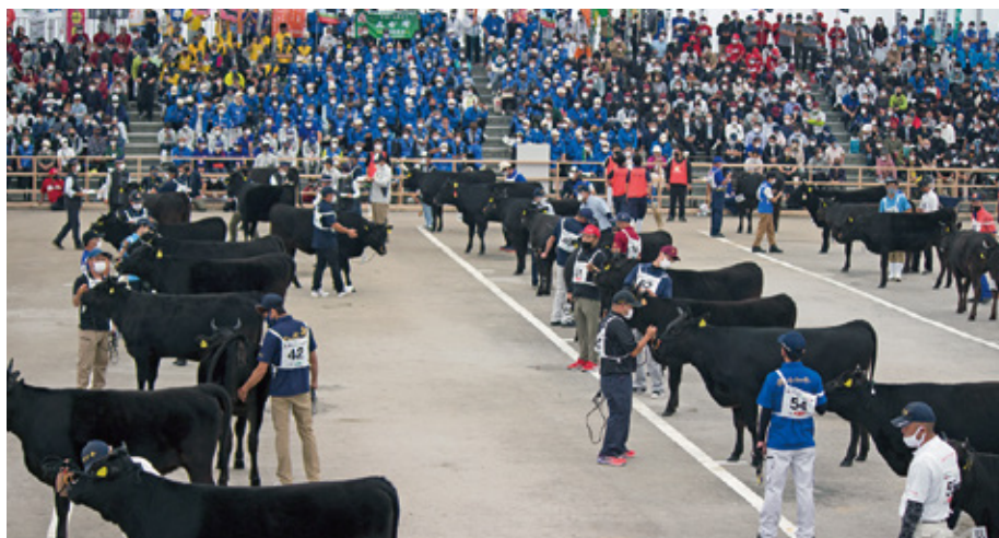
第12回全国和牛能力共進会 宮崎県出発式