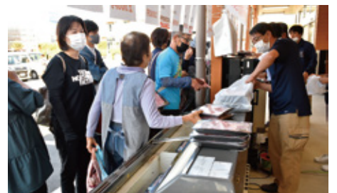
「百笑村小林店」多くのお客様で賑わいました。