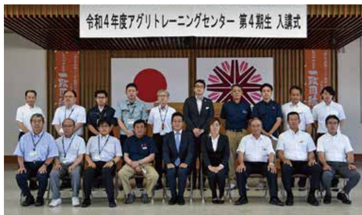
参加者全員で集合写真