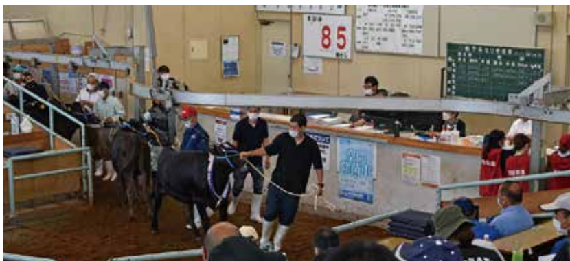
7月期子牛セリ市風景 (単位：頭、円)