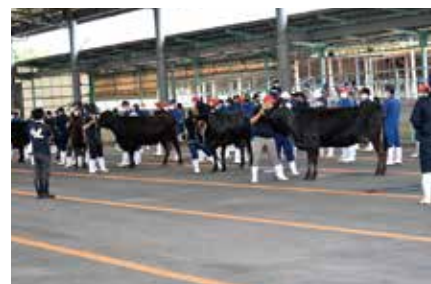
西諸代表決定選の様子