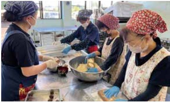
らくがんを型につめる様子