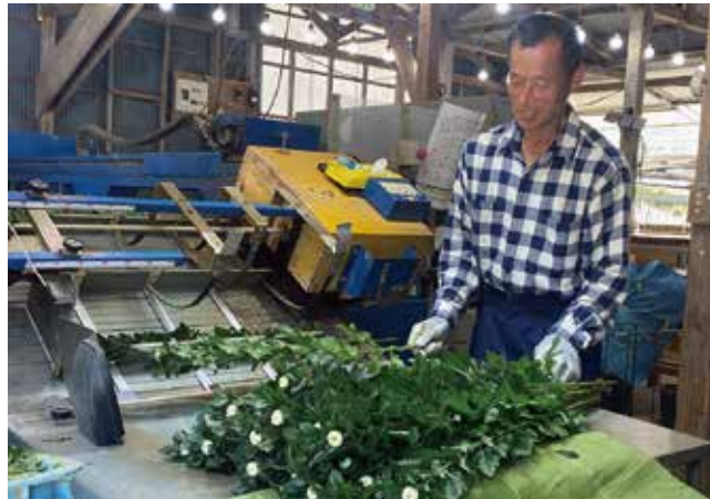
機械での選別の様子