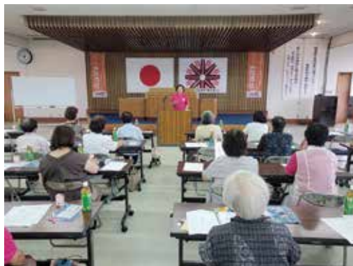
リーダー学習会の様子

また、メーカーを招いて薬用歯磨きアパナチュールの紹介や、本部長によるシンプロロジー体操も行われました。