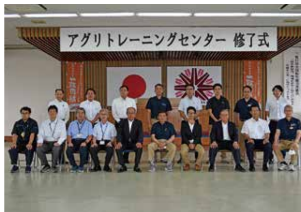
参加者全員で集合写真