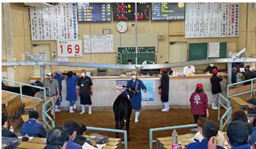
10月期子牛セリ市風景