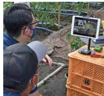
モニターを確認する様子

この模様は、10月31日（日）のUMKテレビ宮崎『oh! 宮崎 大地のチカラ』で放送されました。