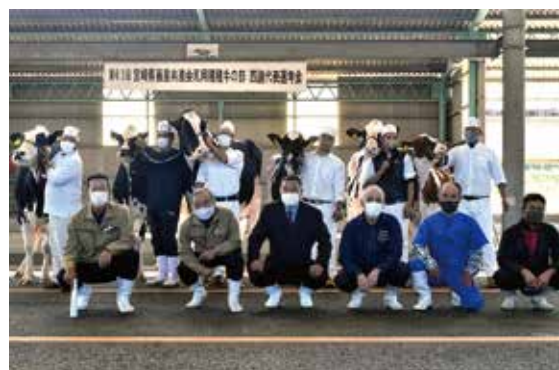
入賞者と集合写真