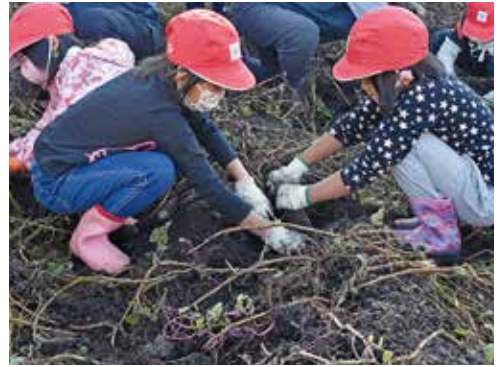
共同作業で芋を掘る様子