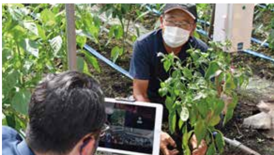
定植のレクチャーをする猿渡部会長