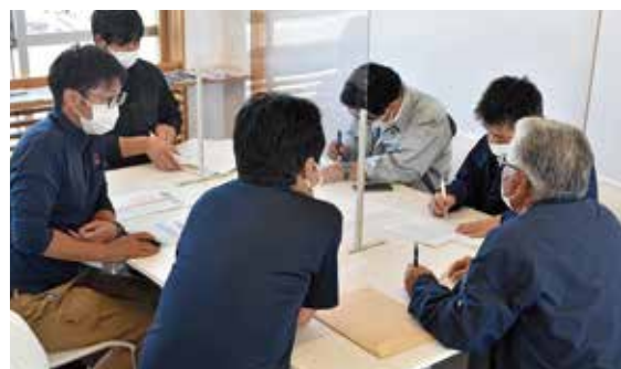
生産者の相談に応じる各関係職員