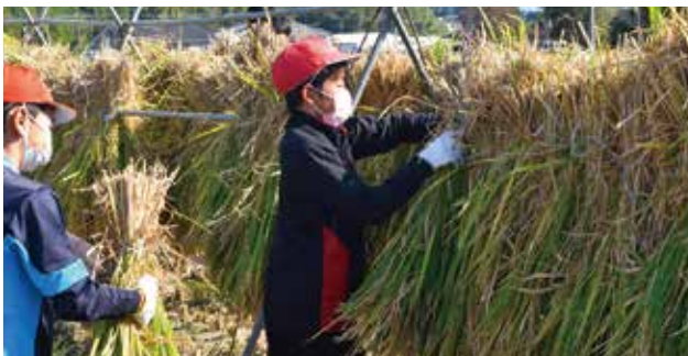
束ねた稲を掛ける様子