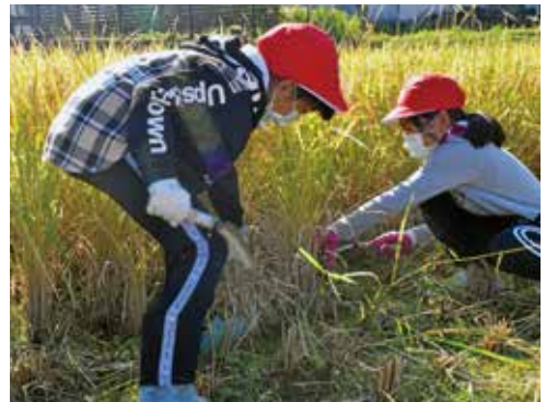
稲刈りに熱中する児童

参加した児童は、営農組合員の方々に教わりながら、初めての鎌で稲刈りを体験しました。圃場の3分の1ほど鎌で稲を刈り、刈り取った稲をコンバインで脱穀作業を行った後、残りをコンバインでの稲刈り作業を見学しました。参加した児童は「鎌で刈るのは楽しい。もっとやりたい!!」と元気に話してくれました。