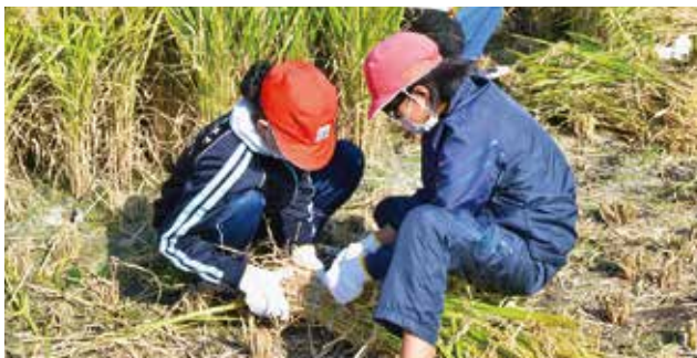
共同作業で縛る様子

まず、西支部盟友が圃場の半分程度をバインダーで刈り取りし、掛け稲の準備をした後、参加した児童全員で、鎌を使って稲を刈る係、バインダー紐で稲を束ねる係、束ねた稲を掛け稲する係と役割を分担して作業を行っていました。今後は、脱穀や粳摺りなどの作業を経て「もち米」になることを学びます。