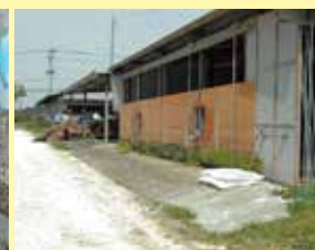
畜舎入口への石灰散布