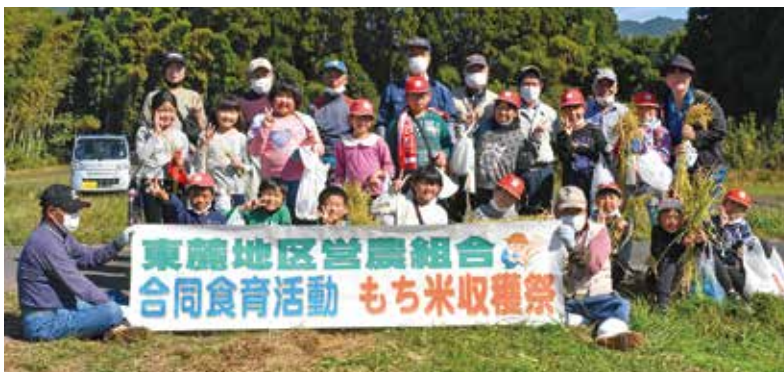
野尻小学校3年生と営農組合の皆さん