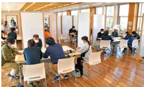
相談会会場の様子

相談会は、紙巻きタバコ消費減少に伴い品目転換予定17戸の葉タバコ生産者を対象に行われ、振興局から品目転換支援の経緯・品目の経営シミュレーションの概要説明、JAからは葉タバコからの代替候補品目などの説明のあと、コーナーごとに相談希望者と個別に面談を行いました。