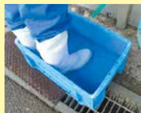
踏み込み消毒槽の設置

畜産農家の皆さんは、飼養衛生管理基準を守って頂くとともに、畜舎内の衛生管理を点検し、一斉に畜舎等の消毒を行いましょう。