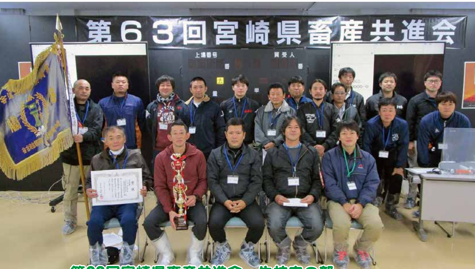
第63回宮崎県畜産共進会 牛枝肉の部