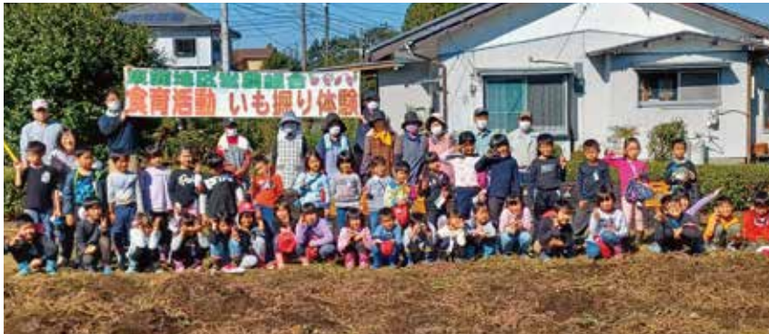
野尻小学校1・2年生とPTAの保護者と野尻支所の皆さん