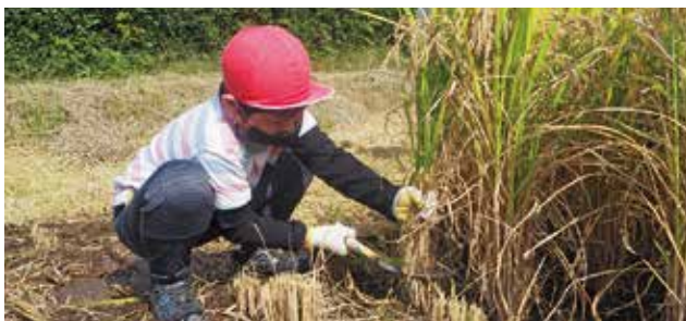
無我夢中で稲を刈る児童

同青年部盟友から鎌の使い方の説明を受けた後、児童らはさっそく盟友の皆さんと一緒に稲刈りを開始。子供たちは慣れない鎌に戸惑いながら稲を刈り、刈り取った稲をコンバインで脱穀作業を行いました。今後は家庭科の授業や餅つき大会などで、収穫の喜びをみんなで楽しむ予定です。