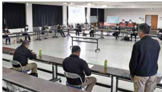
意見要望に対して回答する役職員