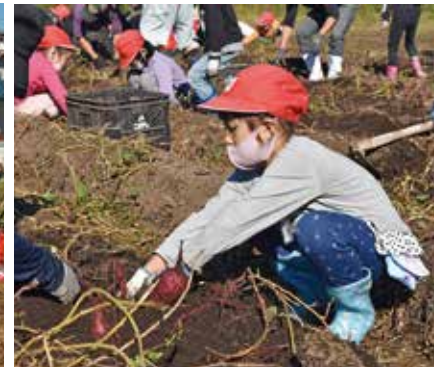
無我夢中で大きな芋と格闘する様子