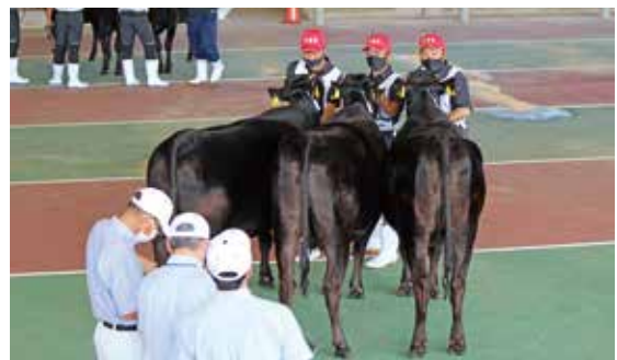
共進会の審査の様子