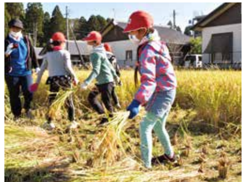
刈った稲穂を並べる児童