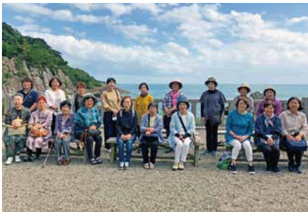
10/4 女性部北・東方支部 日向市 大御神社

両支部とも好天に恵まれ、ソーシャルディスタンスを守り笑顔溢れる支部交流会となりました。