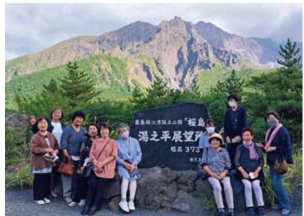
10/9 女性部須木支部 桜島湯之平展望所