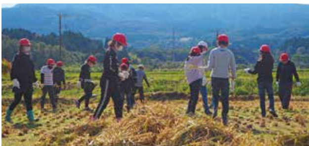
最後の一本まで稲穂を探す子供たち