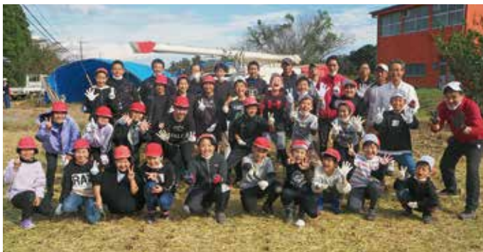
高原小学校5年生とJAこばやし青年部高原支部の皆さん