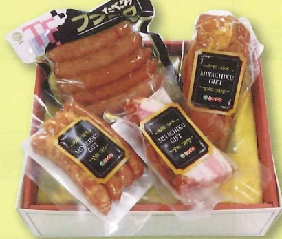
ミヤチク ハム・ソーセージセット (フランクフルト・カットベーコン・スモークチキン・粗挽きウインナー)