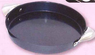
オーブンプレート 20cm(フタ付)