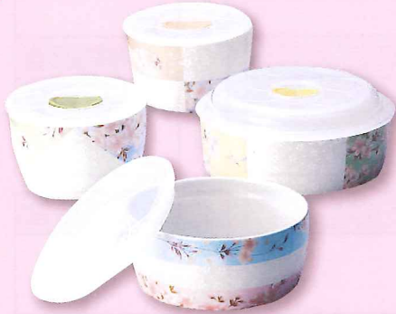
レンジパック 4点セット

*これから年金をお受取りを開始する方、または年金の口座をJAに変更していただける方が対象です。