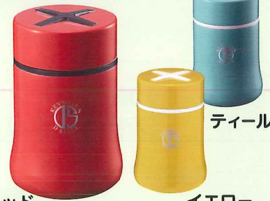
レッド イエロー ティール KEVNHAUN スープマグ 280ml

ご紹介方法 ▶ 裏面の「年金ご紹介カード」にご記入のうえ、お近くのJA窓口までお持ちください。