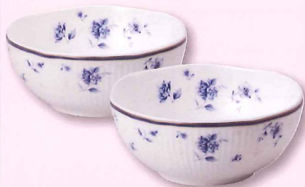
ナルミ シャンソネット ペアボウル

ご紹介者さまへ ▶ ご紹介された方が年金振込をご指定いただくと ▶ お好きな商品をおひとつプレゼント!!