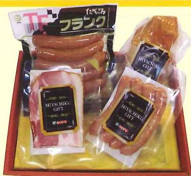
ミヤチク ハム・ソーセージセット (フランクフルト・カットベーコン・スモークチキン・粗挽きウインナー)